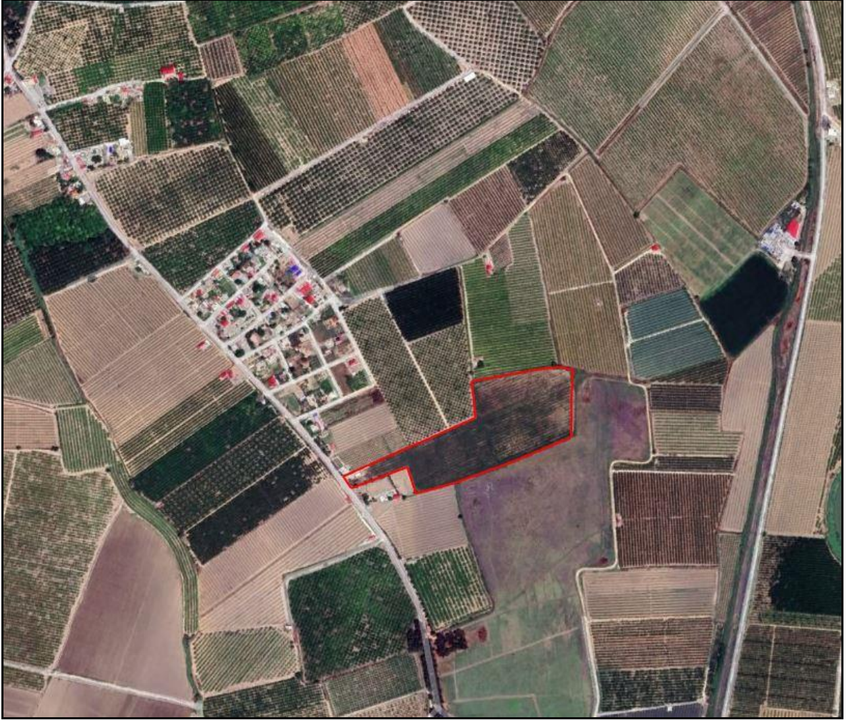
Şekil 1. Planlama Alanının Konumu

Uygulama imar planı konu edilen alan Mersin İli, Tarsus İlçesi Mantaş Mahallesi 115 ada 32 parsel numaralı taşınmazı kapsamakta olup alan yaklaşık 38.201 m 2 büyüklüğündedir. 1/1000 ölçekli O33B14A3B, O33B14B4A halihazır paftalarında yer almaktadır. Söz konusu taşınmazın bir kısmı Mantaş Köy Yerleşik Alanı sınırlarında kalmaktadır. (Şekil 1.)