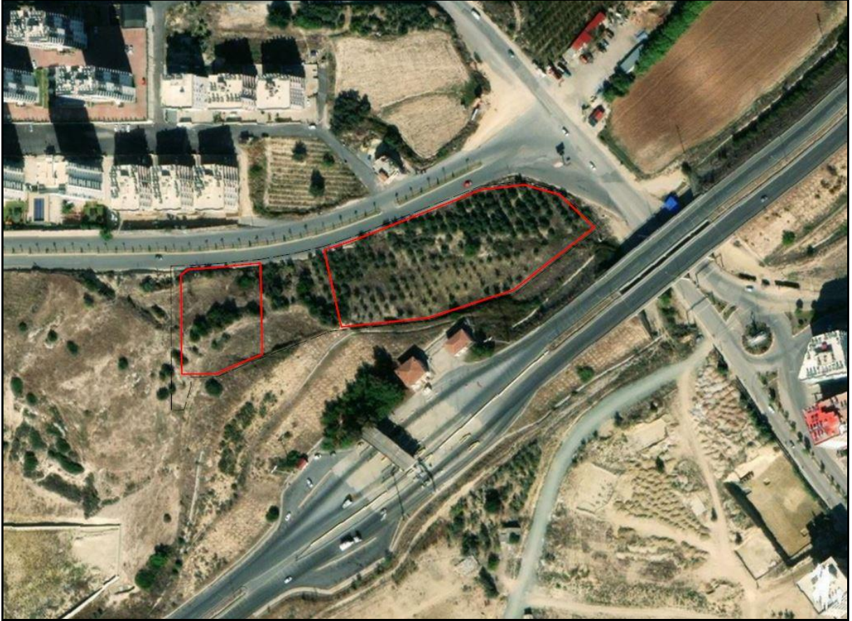
Şekil 1. Planlama Alanının Konumu

Uygulama imar planı konu edilen alan Mersin İli, Tarsus İlçesi Atatürk Mahallesi 4926 ada 1-2 parseller ve çevresini kapsamakta olup plan değişikliği sınırı alanı yaklaşık 14.874 m 2 büyüklüğündedir. 1/1000 ölçekli O33-B-08-A-1C ve O33-B-08-A-1D halihazır paftalarında yer almaktadır. (Şekil 1.)