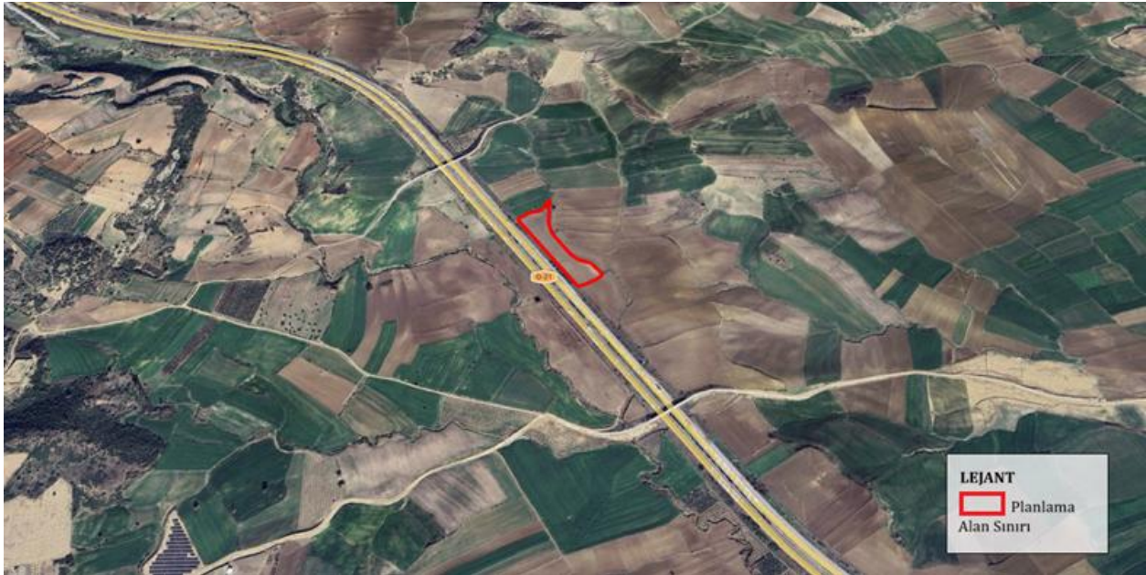
Harita 2 Planlama alanının yakın uydu görüntüsü