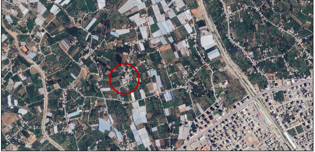
Harita 1: Plan Değişikliği Alanının Uydu Görüntüsü